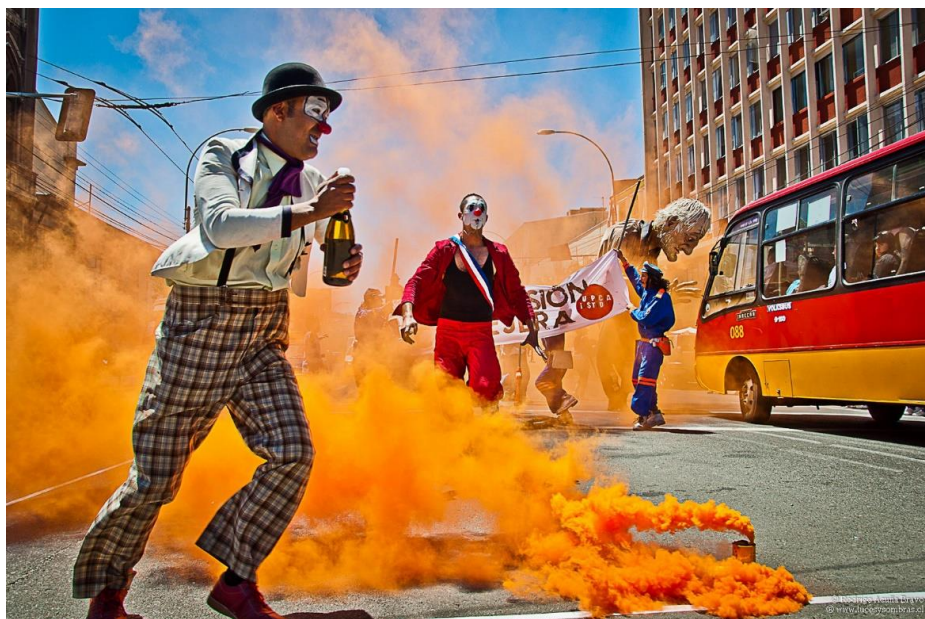
Figura 1. Intervención en la Avenida Pedro Montt de Valparaíso en el evento Invasión Callejera 2010.

Otro ejemplo de uso cultural del espacio público en Chile, pero más enfocado hacia las artes escénicas es el festival Teatro a Mil, que nace en la década de 1990 y que a mediados de los 2000 comienza a impulsar con mayor fuerza el teatro en la calle, con un efecto importante hacia la masificación del acceso a la cultura, al poner en escena obras gratuitas y con contenidos enfocados hacia un público menos elitista (Muñoz, 2010). El evento Invasión Callejera realizado en Valparaíso entre 2009 y 2012 es también un ejemplo interesante con un enfoque de los “espectáculos callejeros”, y que reunían diversas intervenciones teatrales y vinculadas al mundo del circo en calles, espacios públicos y carpas.