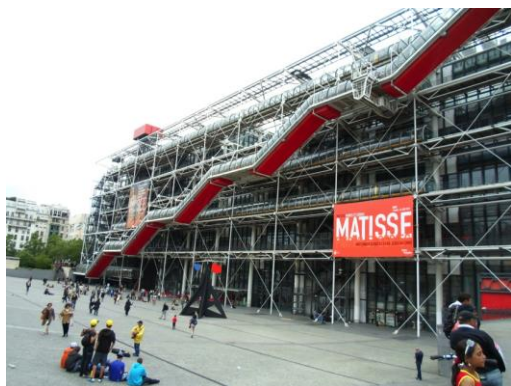
Fig.1. Explanada del Centro Pompidou, París.

En su momento el Centro Pompidou desató fuertes críticas como objeto urbano-arquitectónico y como objeto de consumo cultural masivo. Para varios grupos intelectuales y artísticos representaba el declive de la cultura, su muerte y el surgimiento de una contracultura negada por una arquitectura exterior (Baudrillard, 1978: 83-87). A pesar de ello, al menos en términos urbanísticos y de desarrollo económico y cultural de la capital parisina, el museo fue una intervención acertada y que por lo menos hasta los años 1990 vitalizó todo el sector de su implantación y más aún, irradió su prestigio a todo el barrio del Marais, del cual se ha vuelto emblema. Así a cuarenta años de su apertura el Centro Pompidou ha alcanzado el objetivo de acercar la cultura a las masas –aunque estas no sean necesariamente las masas populares, pero sí una masa de clases medias y medias altas tanto parisinas como internacionales–, y de comenzar una profunda transformación socio-espacial de su territorio. Conscientes del éxito de la propuesta, también ha contribuido a la notoriedad internacional de París, atrayendo a más de tres millones de visitantes anuales entre locales y turistas, mayoritariamente extranjeros.