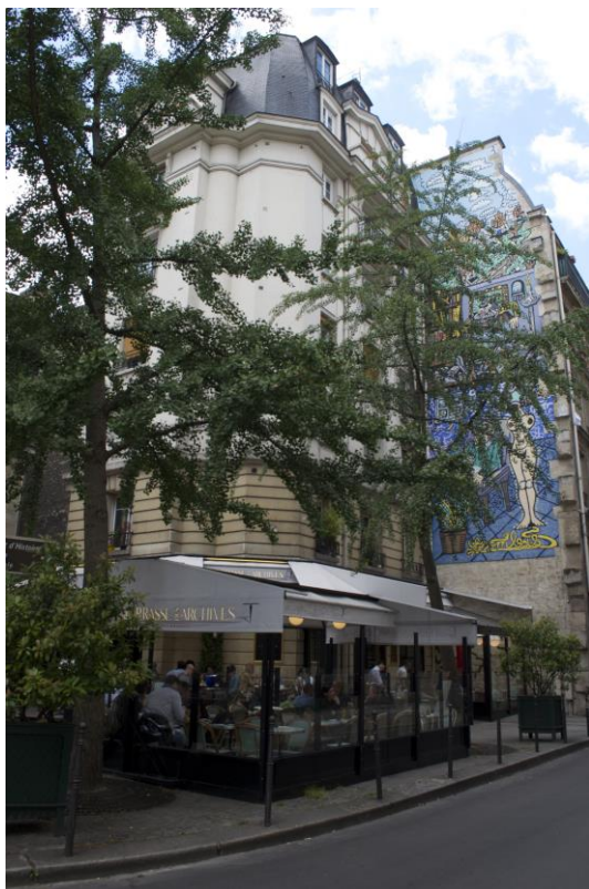
Fig. 4. Gentrificación de barrios centrales promovida por la implantación de un museo. Rue des Haudriettes en el barrio del Marais, adyacente al Centro Pompidou. Aspecto de usos del espacio público y privado, derivados de nuevos usuarios y habitantes con poder adquisitivo superior.

el binomio turismo cultural / museo ha tenido como consecuencia el alza del valor del suelo, la transformación de uso de suelo, la rehabilitación de viejas viviendas degradadas, la construcción de nuevos establecimientos comerciales, una nueva concepción del espacio público y la reconversión de áreas industriales en equipamientos urbanos o actividades terciarias. El resultado es que la ciudad se adapta al consumo de un alto poder adquisitivo en detrimento de poblaciones con menores recursos (Boldrini, 2014: 160).