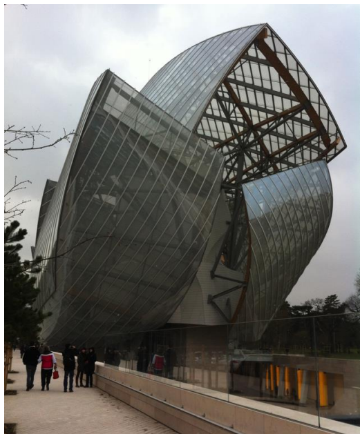
Fig. 3. Fundación Louis Vuitton

para su contexto. Es cierto que se trata de un proyecto de iniciativa privada, pero su ubicación en un predio dentro del Jardín de Aclimatación del Bois de Boulogne al oeste de París y en el prestigioso XVI e arrondissement, da cuenta de que las más recientes generaciones de museos pueden tener menor interés urbano y social en su contexto, y convertirse plenamente en empresas culturales. Más aún, al menos en el caso de la Fundación LV asociada al consumo de lujo, ella se beneficia de la imagen de los Beaux Quartiers del oeste de París. Es decir la marca LV suma un valor simbólico agregado, el prestigio de la ciudad de París, su patrimonio y su art de vivre francés.