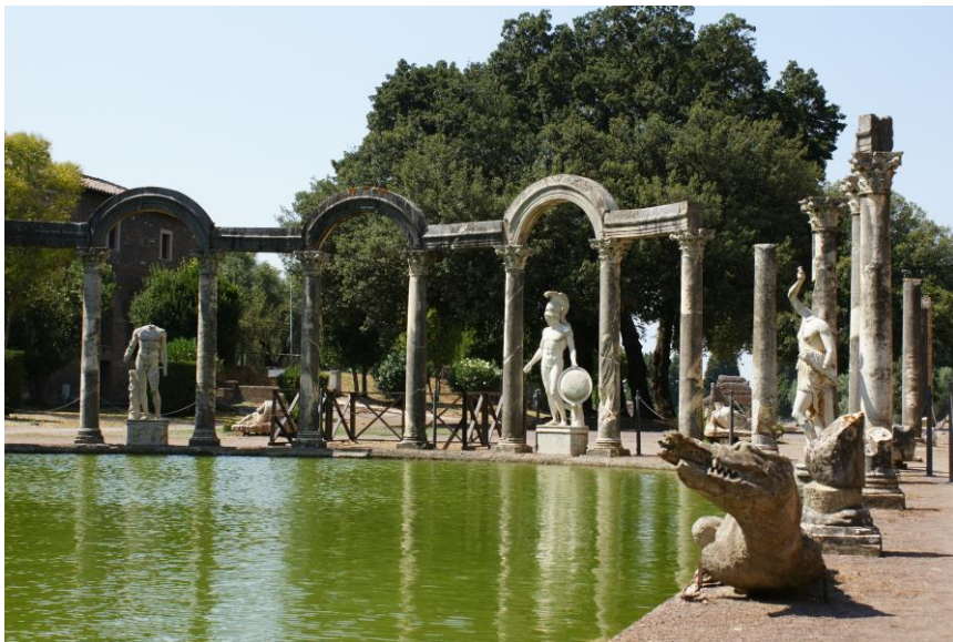
Fig. 5. Esculturas de dioses y héroes en el Canopo de la Villa Adriana (s. II), Tívoli, Roma.

se cumplieron los seis requisitos de Berque, lo hicieron ligados a una concepción de la naturaleza alejada de anteriores connotaciones religiosas. Que esto sucediera durante el Imperio Romano (o al menos en su capital) no parece extraño por dos motivos: el primero está relacionado con la visión romana del territorio como espacio para la conquista y el engrandecimiento del Imperio (también como lugar de construcción de las primeras grandes infraestructuras de la historia); el segundo, porque siguiendo algunos textos, la realidad mítica durante tanto tiempo observada por los griegos, parecía en esta cultura más una tradición que una verdadera creencia, y no concordaba con la vida que fluía por sus calles 11 (Fig. 5). Es decir, aquella realidad mítica de las primeras civilizaciones fue quedando restringida a algunos lugares y personajes públicos (templos, palacios, faraones, emperadores, sacerdotes, etc.) y perdía cada vez más fuerza en la vida del día a día. Dicha forma de entender el mundo mucho más laica se asemeja en cierto modo a la del Renacimiento, cuando nació el paisaje en Occidente.