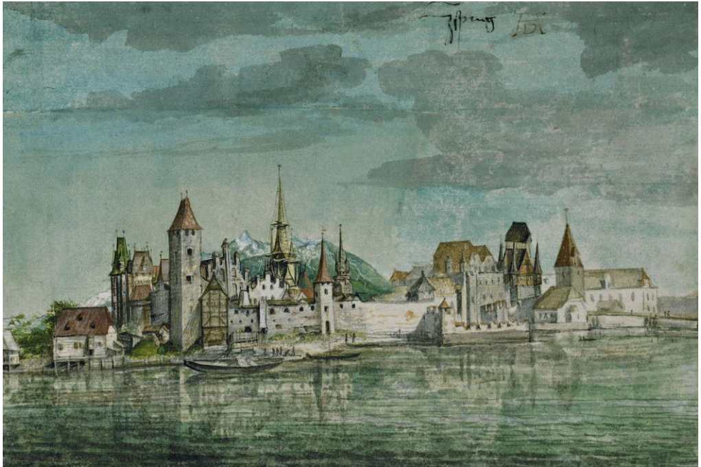
Fig. 2: Las vistas de Alberto Durero están consideradas como las primeras pinturas de paisajes. Durero, Innsbruck desde el Norte (1496/97), Graphische Sammlung Albertina, Viena.

de la creencia de que todo participa de la misma naturaleza universal. Por su parte, en Europa, el alumbramiento del paisaje acaecido en el siglo XV estuvo desde sus inicios ligado a visiones artísticas y estéticas (Fig. 2), y distanciado de consideraciones espirituales. Por otra parte, las voces en las que encuentra su raíz la palabra ( pagus en las lenguas romances y landskip en las germánicas), se referían a la organización del espacio, a la relación de los habitantes entre sí y con el lugar, y a las obligaciones de estos para con la comunidad y la tierra (Carapinha, 2009:114). La noción más actual expresada en el Convenio Europeo asume las acepciones artísticas de los primeros paisajes y también las del antiguo pagus , pero se mantiene igualmente alejada del concepto oriental.