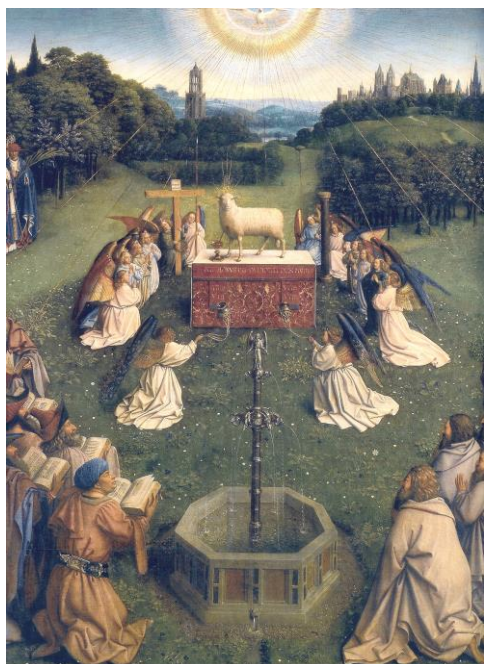
Fig. 6: Hubert y Jan van Eyck, detalle de la Adoración del Cordero Místico (1432), Catedral de San Bavón, Gante. (File: Retable de l'Agneau mystique.jpg)

La brecha creada entre el mundo natural y el humano se hizo más profunda con el abandono del politeísmo, no tanto por el avance del pensamiento racional (como había ocurrido hasta entonces), sino por la relación que el hombre y la mujer establecieron con la naturaleza siguiendo, aparentemente, designios divinos.