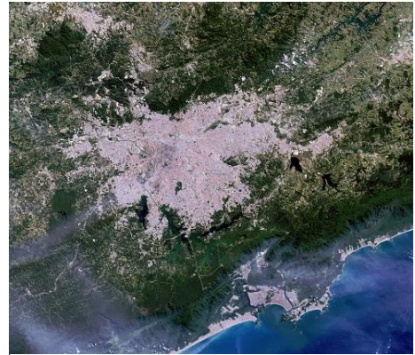
Fig. 9: Vista satelital del área urbana de Sao Paulo, Brasil.

Según ambos filósofos, a partir de entonces comenzó la decadencia de una sociedad que desembocaría en los totalitarismos del siglo XX. Los nuevos tiempos y la industrialización impusieron la primacía de la máquina (Figura 9). En un siglo y medio, la igualdad de fuerzas que tanto había costado conseguir, el equilibrio del individuo entre su yo racional y su yo natural, y el de la sociedad civilizada entre el progreso y el mundo natural, viró hacia el lado contrario. Lejos del miedo, el individuo comenzó a utilizar su poder y su dominio sobre una naturaleza a la que consideraba cada vez más lo otro, lo ajeno, lo diferente. El péndulo, que durante siglos fue acercándose lentamente al eje, osciló bruscamente hacia el lado contrario y allí ha quedado anclado desde entonces. El tan floreciente equilibrio se rompió de nuevo. En adelante, era David el que ganaba casi todas las batallas, y un Goliat cada vez más exhausto despertaba de cuando en cuando lanzando huracanes o terremotos: recordatorios de un gigante que se revuelve contra sus cadenas.