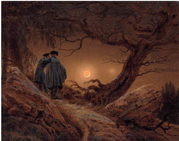
Fig. 8: Caspar David Friedrich, Dos hombres contemplando la luna (1819), Gemäldegalerie, Dresde. ( https://es.wikipedia.org/wiki/Caspar_David_Friedrich#/media/File:Caspar_David_Friedrich_-_Zwei_M%C3%A4nner_in_Betrachtung_des_Monds.jpg ) (©Public Domain)

A principios del siglo XIX, la aceptación generalizada de la propuesta hegeliana de que la Estética debía limitar su estudio a la filosofía del Arte en lugar de a la belleza natural (Jarque, 1996: 233-238), no solo cambió el curso de las cosas, sino que afectó nuevamente la percepción de la naturaleza. La falta de reflexión estética sobre lo natural producida desde entonces tuvo numerosas consecuencias 18 , algunas de las cuales repercutieron en la configuración de los paisajes. La idea de que la belleza natural no merecía investigación alguna unida a la superioridad estética de las creaciones humanas sobre las naturales, suponía un problema añadido a la consideración de la naturaleza como otredad (que se venía gestando desde el Renacimiento): el de su escasa belleza. De otro