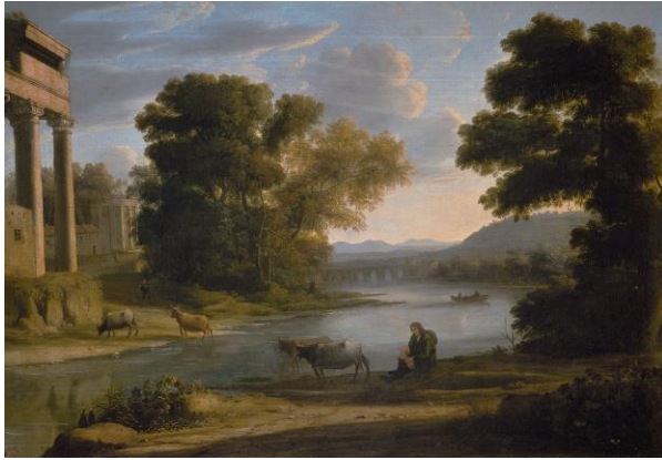
Fig. 7: Claudio de Lorena, El vado (c. 1644), Museo del Prado, Madrid. ( https://es.wikipedia.org/wiki/El_vado_(Claudio_de_Lorena)#/media/File:El_vado,_Claudio_de_Lorena.jpg ) (©Public Domain)