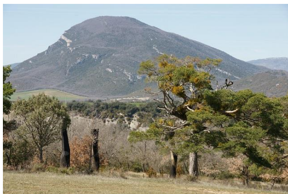
Fig. 10: David Nash, Three Sun Vessels for Huesca (2005), Centro de Arte y Naturaleza de Huesca.

tierra como materia y como soporte de experimentación, en el espacio y el tiempo geológico, histórico, cósmico, y volvieron la mirada hacia las antiguas civilizaciones. En Europa, otros artistas recogieron el testigo de Richard Long (Hamish Fulton, Andy Goldsworthy, David Nash o Nils-Ud) y pusieron la mirada en la naturaleza (Fig. 10). Desde entonces, el Arte viene ofreciendo soluciones a problemas ecológicos y medioambientales desde las visiones artísticas, en ocasiones con proyectos de recuperación ambiental 20 , y en otras, con obras gestuales, señalizaciones temporales, silenciosas e íntimas 21 . Utilizan materiales naturales como la tierra, las piedras, la vegetación, el agua, el fuego o el aire, juegan con procesos naturales y ponen en valor el lugar. Les interesa la relación del individuo con la naturaleza y con los animales, los procesos naturales, los de ejecución de las obras y su desaparición, la percepción, la reacción del espectador. Sus obras ponen de manifiesto una clara conciencia del impacto del ser humano sobre el planeta y hacen lo que sabe hacer el arte: poner ante nuestros ojos la realidad.