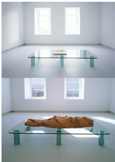
Fig. 9. Shroud/Chrysalis , 2000. Catherine Richards. http://www.fondation-langlois.org/html/e/page.php?NumPage=162

del ciudadano como en: Nodo móvil , Infocalypse Now! , AllFm Tallin , Estonoesinternet , Wifi.Bedouin , Porta2030 , etc; prácticas que nos alertan de los peligros de las radiaciones electromagnéticas: Skrunda Signal , Latvian Electromagnetic pollution , Spectrum Survey , Tempest , etc; piezas que nos protegen de los efectos de las radiaciones: Shroud/Chrysalis y Telepathy ; e intervenciones que tratan la privacidad y el control de dicho espacio: Life: A user's Manual , X.pose , Spam Tower , Yellow chair , etc.