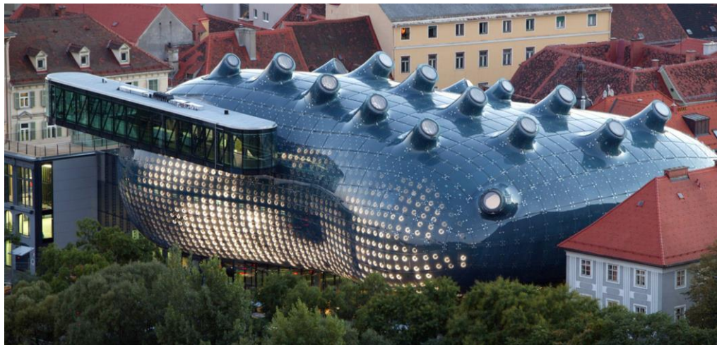
Fig. 4. Bix Electronic Skin en Graz, Austria.

miento configuradas a tiempo real, como el Bix Electronic Skin en Graz (Austria), la Galleria Hall West, en Seul (Korea) o la fachada digital del Medialab Prado en Madrid (España), entre otros muchos.