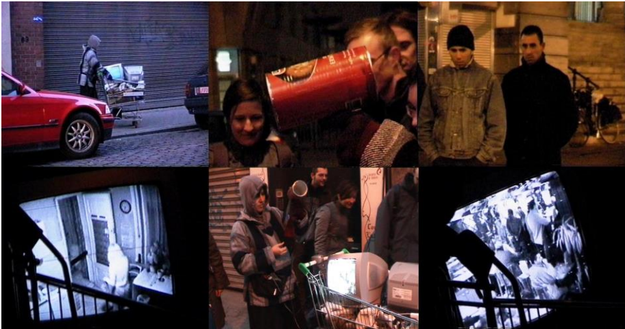
Fig. 2. Life a user's manual , 2003. Michelle Teran.

ciones artísticas, precisamente lo vemos con un sentido activista en la obra de Michelle Teran, life a user's manual (2003), quien equipada con un antena de 2,4Ghz y televisores de tubo, captaba las señales de las cámaras inalámbricas de videovigilancia domésticas en recorridos por las ciudades, y las mostraba en video a tiempo real, comprobando que los límites de la realidad física, no coinciden con los del espacio hertziano.