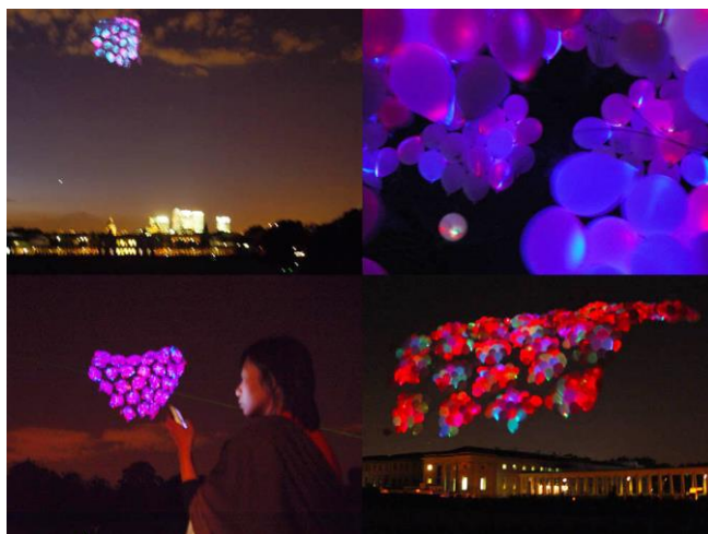
Fig. 5. Sky Ear , 2004. Usman Haque. Extraída de la web del autor: http://www.haque.co.uk/skyear/information.html

Relacionado con los nuevos medios de comunicación (inalámbricos) y con las tecnologías y dispositivos móviles con acceso a Internet, podemos señalar el territorio informacional de André Lemos (Lemos, 2008). Un espacio híbrido, aumentado, compuesto por flujos, donde lo real y lo virtual se cruzan, y donde múltiples espacios locales se mezclan cuando nos adherimos a la red (en movilidad), interconectando los lugares desde donde consumimos y producimos información. Una realidad, que no se puede separar del ciberespacio, puesto que al estar conectados permanentemente, no podemos separar lo online de lo offline . Este autor señala que lo que define a las nuevas redes es la capacidad de los usuarios de producir contenidos en movilidad (hiperlocalización de la información), consumiendo, produciendo e intercambiando información en forma de datos, mientras transitan, caminan o viajan por las ciudades, o entre ellas.